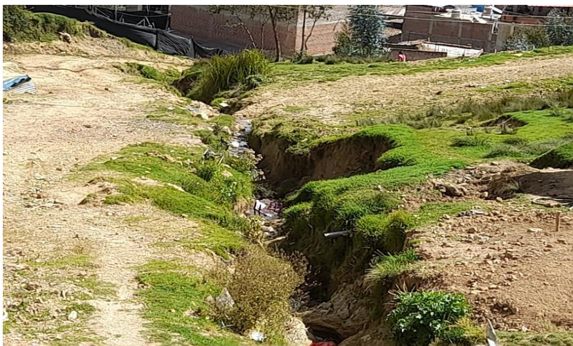
IMAGEN N°01: Se observa la quebrada de los Pajaritos requiere de mantenimiento de cauce