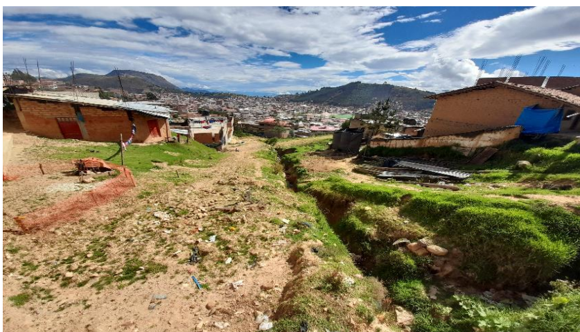
IMAGEN N°02: la quebrada de los Pajaritos se encuentra sin mantenimiento y requiere de intervencion para mitigar posibles desbordes e inundaciones en el sector N°06 de Huamachuco